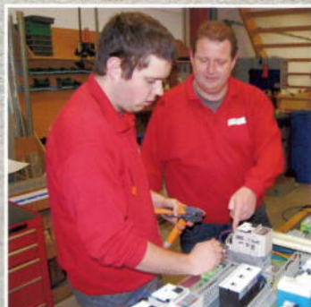
Het brein achter de machine