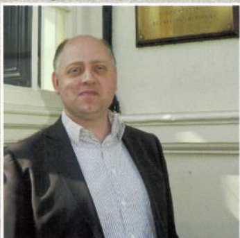
Een betrouwbare financiële partner