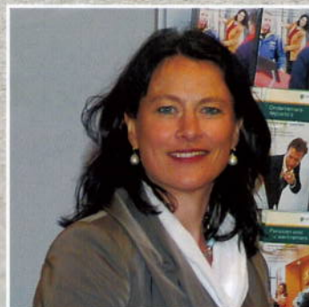
De 'Wereldbank' voor de lokale markt