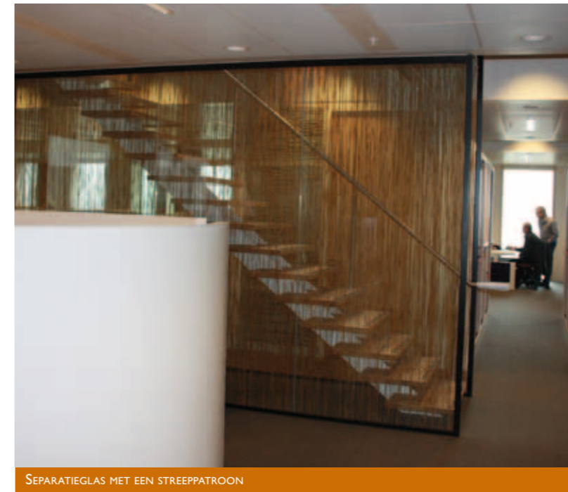
SEPARATIEGLAS MET EEN STREEPPATROON