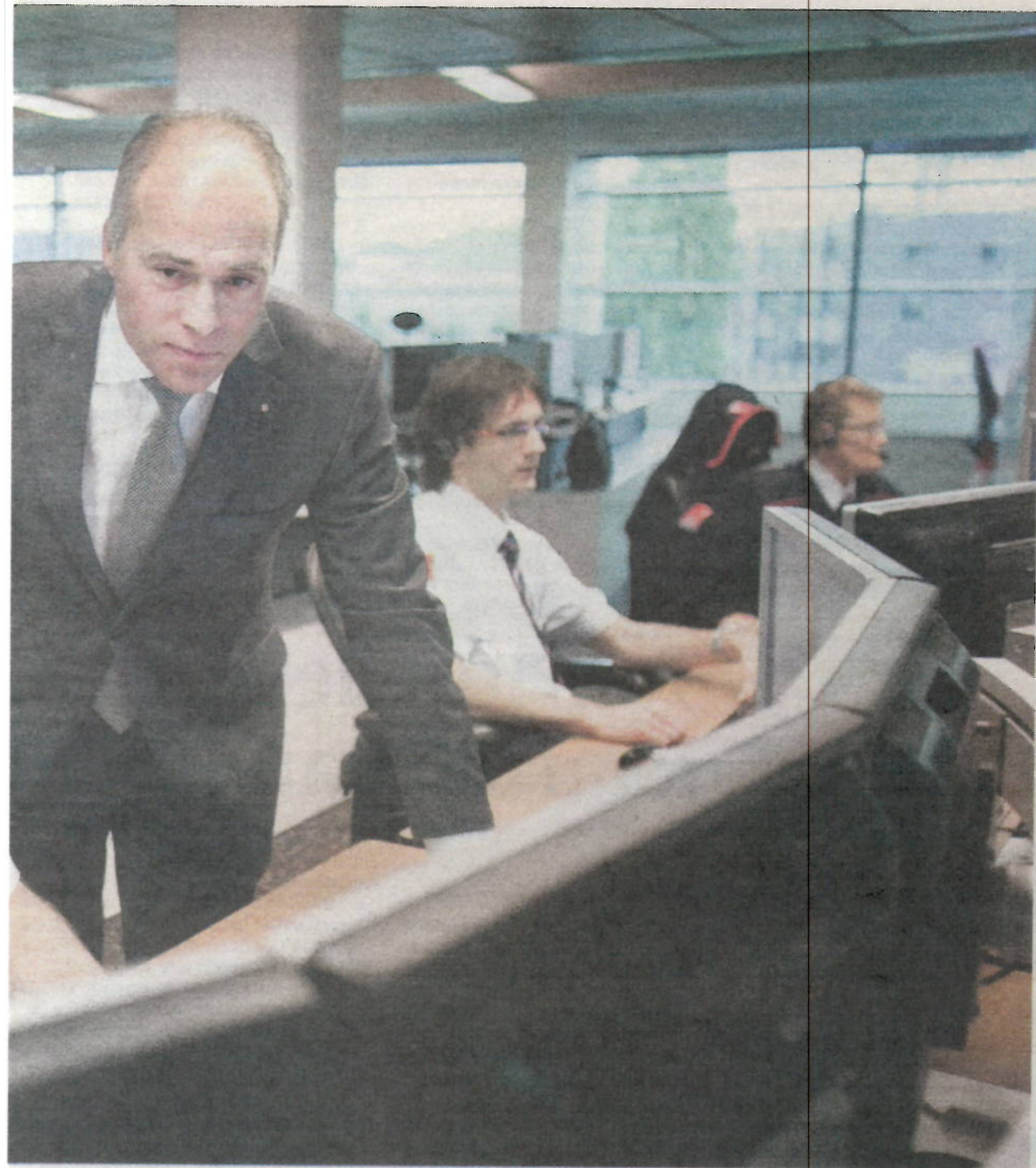
Trigion in de Rotterdamse haven. Nederlandse beveiligingsbedrijven hopen dat het kabinet veel meer overheidstaken kwaliteit te kunnen leveren.