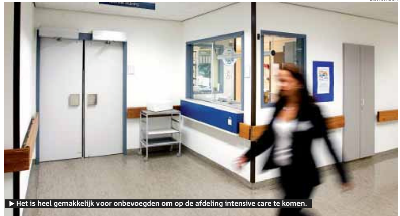
► Het is heel gemakkelijk voor onbevoegden om op de afdeling intensive care te komen.

Veiligheid in ziekenhuizen laat te wensen over. Zo is het voor onbevoegden vaak een fluitje van een cent de intensive care op te lopen. Dat is niet alleen onhygiënisch, ook verdwijnen er geregeld spullen van patiënten.