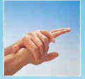
Wrijf de handen grondig in gedurende 30 seconden en laat de handen aan de lucht drogen.