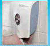
Gebruik zeepdispenser met desinfectiezeep