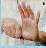
Duimen in handpalm