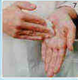
Met vingertoppen in handpalm