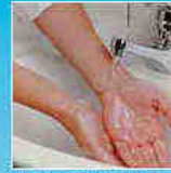
Spoel met water vanaf de handpalmen