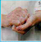
Met gesloten vingers