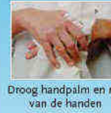
Droog handpalm en rug van de handen