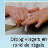
Droog vingers en rond de nagels