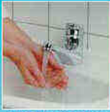
Handen nat maken