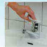
Sluit kraan met handdoekjes