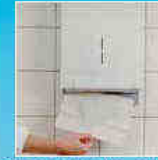
Droog de handen, gebruik papieren doekjes