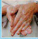
Palmen tegen elkaar